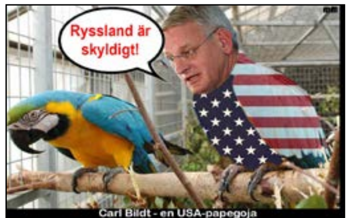
Carl Bildt - en USA-papegoja

• Majoriteten av befolkningen i östra Ukraina utgörs också av ryssar. Genom folkomröstningar har en majoritet uttalat sig för självständighet gentemot regimen i Kiev.