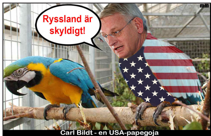
Carl Bildt - en USA-papegoja

• Majoriteten av befolkningen i östra Ukraina utgörs också av ryssar. Genom folkomröstningar har en majoritet uttalat sig för självständighet gentemot regimen i Kiev.