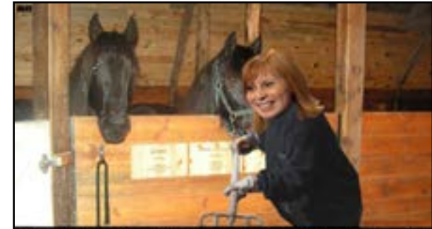
Har hon alla hästar hemma?

Mauds efterträdare, Annie Lööf, har varit inte mindre positiv i sin framtoning. Om hon hade varit meteorolog skulle det ständigt ha blivit prognoser om vackert väder.