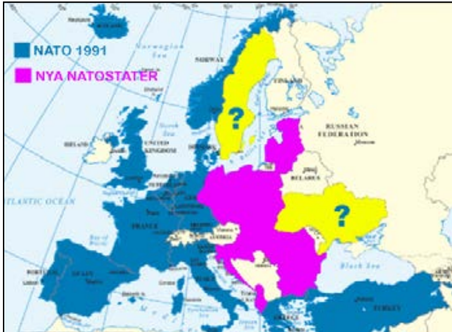
NATO:s östexpansion sedan Sovjetunionens kollaps 1991 har varit dramatisk.