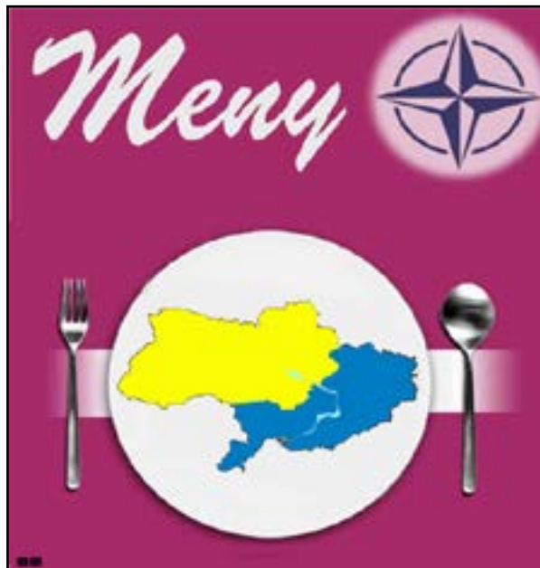
Ukraina har länge också stått på NATO-menyn.