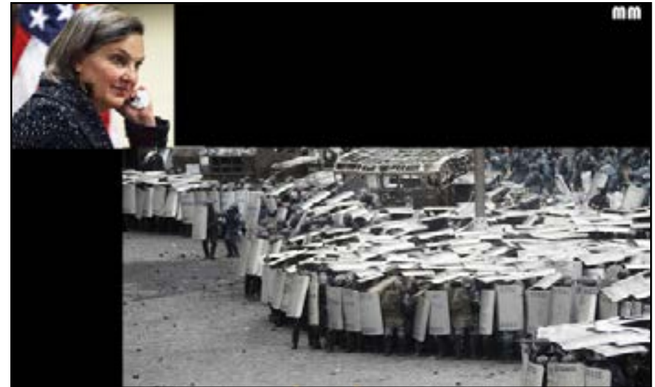
Dirigent var USA:s biträdande utrikesminister, Victoria Nuland . Fem miljarder dollar hade pumpats in i ett ukrainskt regimskifte. Med kuppen släppte man lös en häxbrygd av motsättningar och problem.